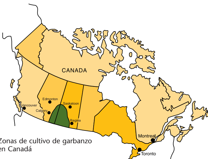
Zonas de cultivo de garbanzo en Canadá